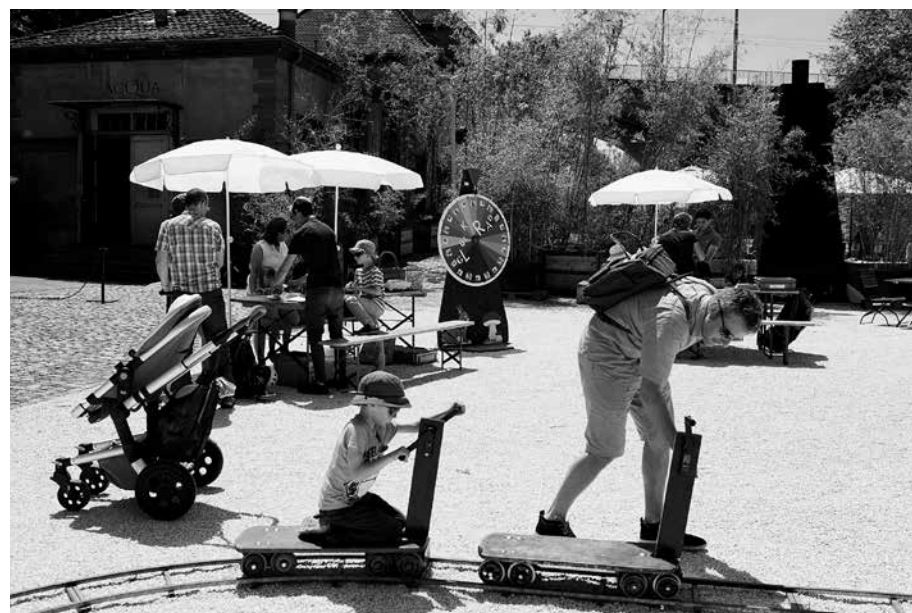
Während am gegenüber liegenden Birsigufer die Kindergärtler ein neues Spielparadies gefunden haben.