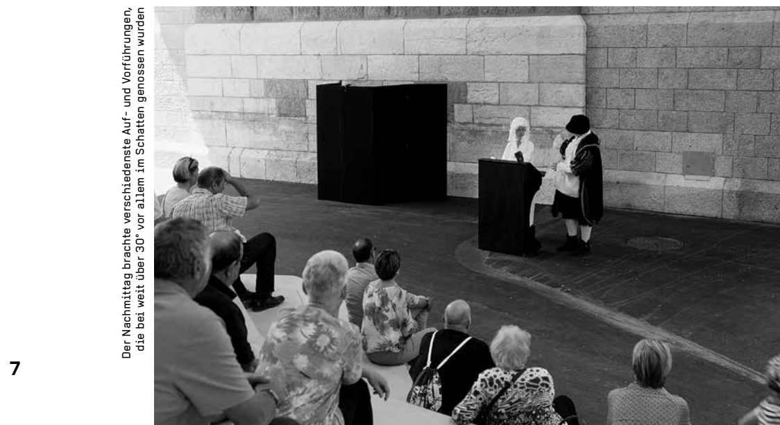
Der Nachmittag brachte verschiedenste Auf- und Vorführungen, die bei weit über 30° vor allem im Schatten genossen wurden