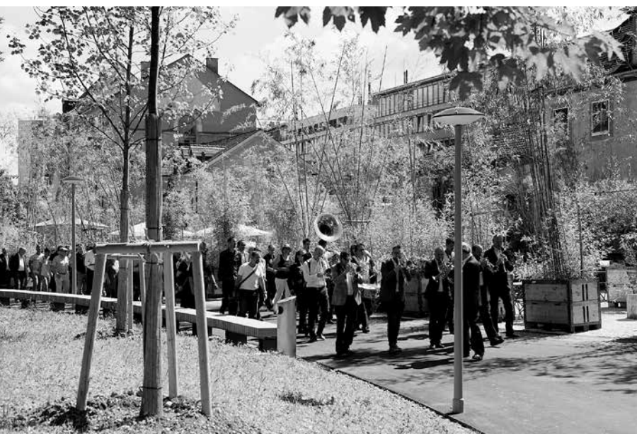
Mit Pauken und Trompeten werden die verschiedenen Stationen des neuen Nachtigallenwäldli-Parks eröffnet

www.ggg-basel.ch/ggg-projekte/ggg-kontaktstelle-gastfamilien-fuer-fluechtlinge/