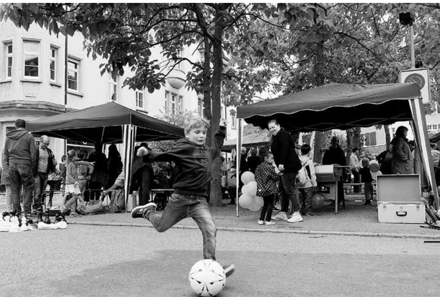
... wo man bei Speis und Trank gemütlich im Schärme zusammensass und sich bei sportlichem Tun zwischendurch aufwärmete. Schön war's!

Sollten Sie einen Hund mit Leseschwäche haben, legen Sie den aufgeschlagenen DIALOG auf den Boden, lassen Ihrem Liebling alle Zeit, die er braucht und lesen am Schluss alles wieder auf. Danke.