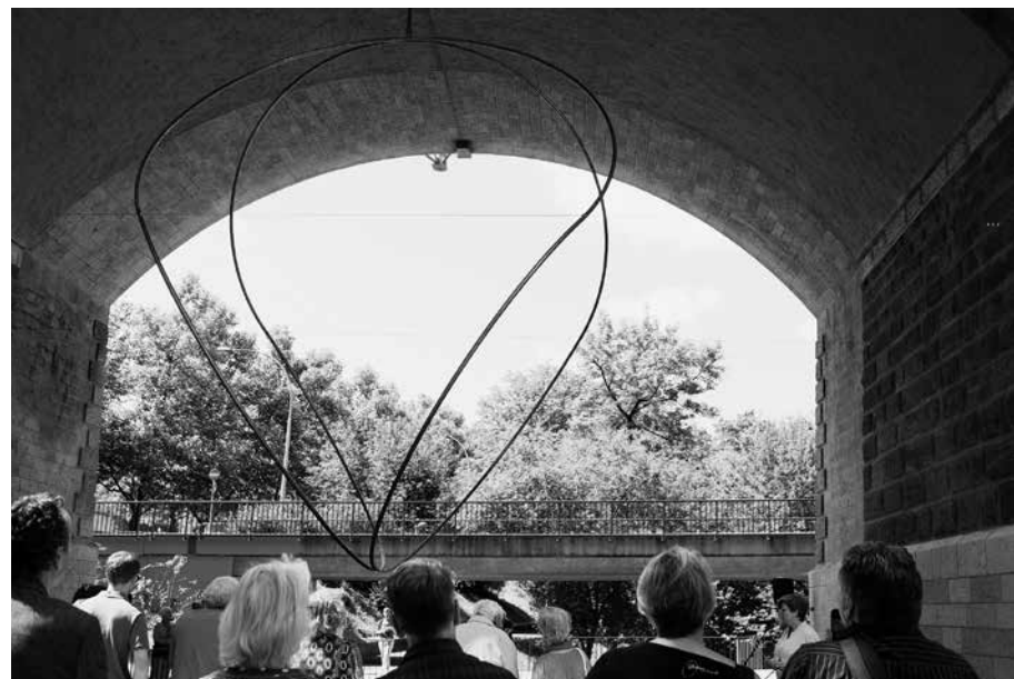
Viel Freude bereitet das Geschenk an die Stadt, das herzlich empfangen wurde und inzwischen bereits Patina angenommen hat.